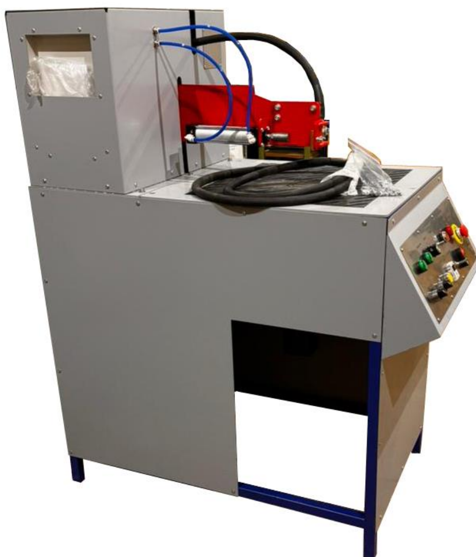
Рис.1. Общий вид установки «Сапфир»

Установка для сварки арматуры под флюсом "Сапфир" предназначена для сварки закладных деталей под флюсом. Станок позволяет получить тип сварного соединения Т1-Мф по ГОСТ 14098-2014 «Соединения сварные арматуры и закладных изделий железобетонных конструкций. Типы, конструкции и размеры».